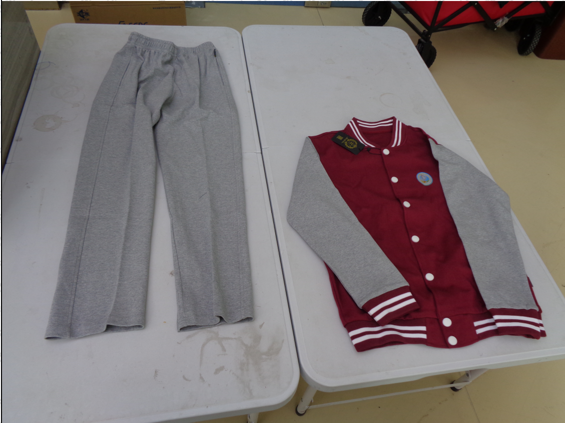
灰色长裤；灰拼红色外套